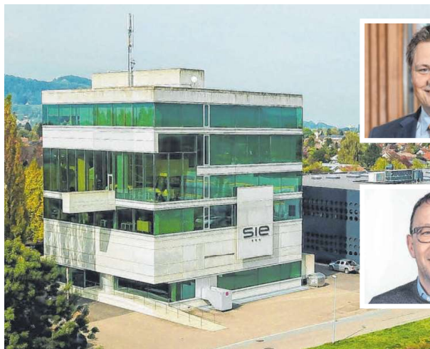
Der Standort von S.I.E. im Lustenauer Millennium Park.